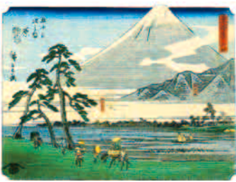
葛屋版東海道原初代歌川広重画