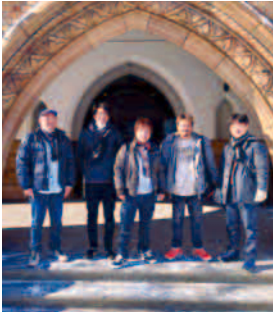
北海道大学総合博物館前にて

どこも外国人観光客が多く、少しずつコロナ前に戻りつつあるような印象を受けました。