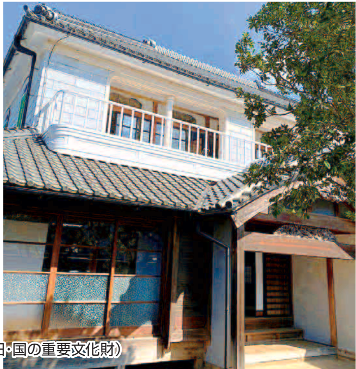
松城家住宅(戸田・国の重要文化財)